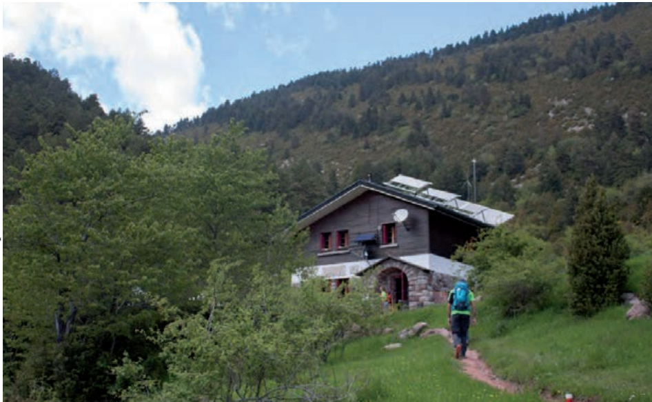
Refugi Sant Jordi, al fons el coll del Pendís.

Però també a nivell de pràctiques. El tradicional excursionista recreatiu està donant pas cada vegada més a una aproximació més esportiva (batejada com “efecte Kilian Jornet”), amb els conseqüents riscos de pèrdues, accidents i una despreocupació major dels clients. Ens explicà un bon nombre de casos de gent que ha fet reserves i no arriben, amb la inquietud de no saber si és una persona que no ha vingut o que s’ha perdut a la muntanya. Al costat d’això, però, el refugi resultà ser un bon aparador del màrqueting associat a les pràctiques a la muntanya, amb abundants referències a les marques associades a aquest nou excursionisme com “Cavalls del Vent” o la “Travessa Muntanyes Màgiques”.